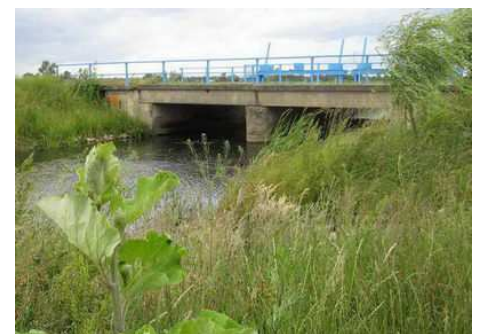
Wehranlage mit Fischtreppe