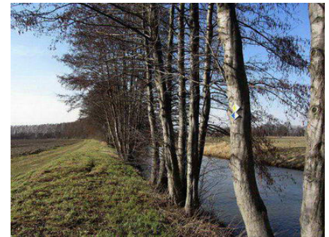
An der Karthane