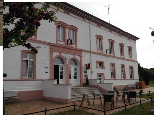
Bahnhofsgebäude mit Touristeninformation und Bistro