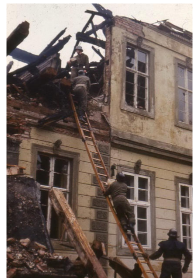
Löscharbeiten beim Brand 1976