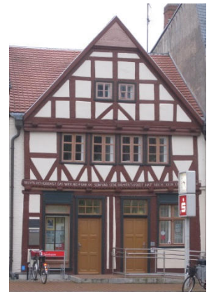
Ältestes Haus der Stadt

Da, wo die Lindenstraße endet und die Wittenberger Straße beginnt, wechseln Sie auf die andere Straßenseite und gehen die Große Straße in Richtung Markt zurück. Sie kommen vorbei am ältesten Haus (21) der Stadt, welches 1692 erbaut wurde und in dem sich heute die Filiale der Sparkasse Prignitz befindet. Gleich