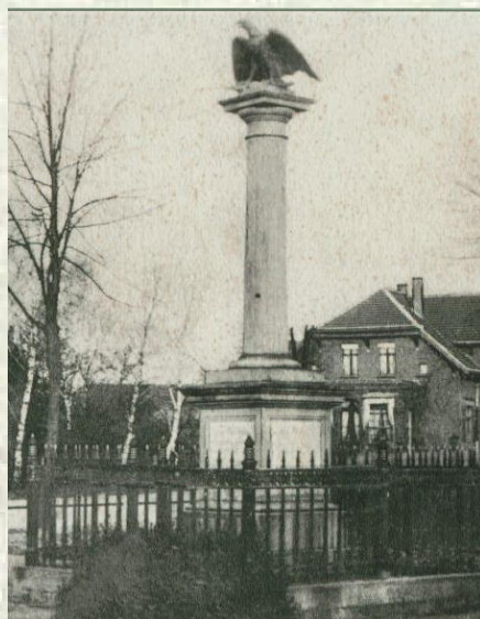
Kriegerdenkmal um 1903