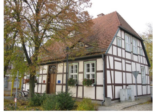
Altes Rathaus (Bibliothek)

Auf der linken Seite, direkt auf der Grünfläche, welche die Hauptverkehrsstraße und die Lindenstraße trennt, befindet sich das alte Rathaus der Stadt. Dort befinden sich jetzt die Bibliothek und das Standesamt von Bad Wilsnack. Sie gehen nun durch die Lindenstraße, entlang an zahlreichen, ansprechend restaurierten Fachwerkhäusern.