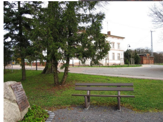
Bahnhofsvorplatz mit Hansen-Gedenkstein