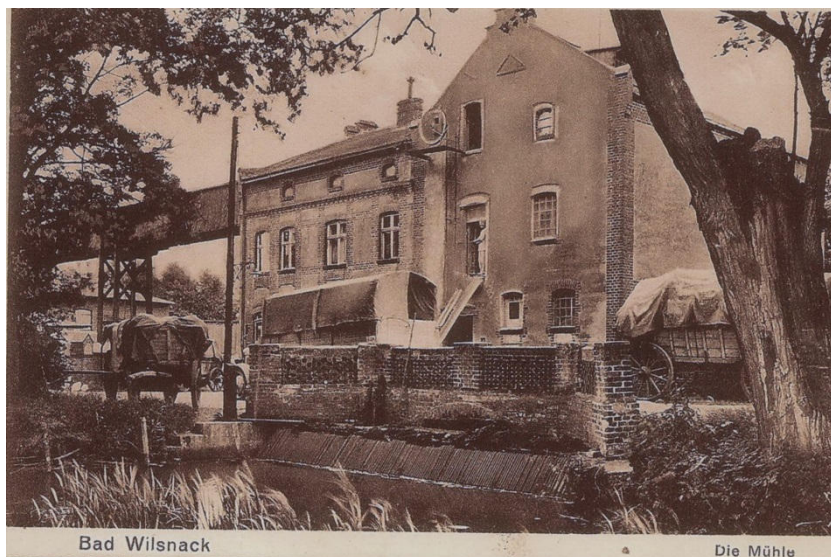
Historisches Foto der Wassermühle um 1918

Folgen Sie dem Weg bis zur Mühlenstraße. Dort, wo sich jetzt der Sitz der Firma Cleo Schreibgeräte GmbH befindet, gab es bis 1963 eine betriebsfähige, über 400 Jahre alte Wassermühle (11) .