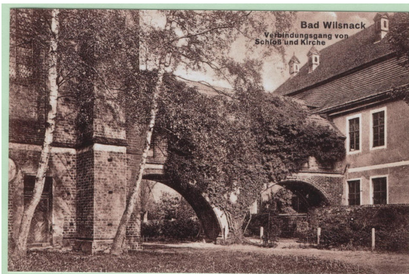
Historische Aufnahme vom Schloss

Jetzt sind Sie am Hauptziel unserer kleinen Stadtwanderung und dem weithin sichtbaren Wahrzeichen der Stadt. Besonders sehenswert sind dort neben dem prächtigen Altar die wunderbare Glasmalerei an den Fenstern im Chor und im nördlichen Seitenschiff und natürlich die ausführliche Darstellung der Geschichte des „Wunderblutes“ und der Pilgerbewegung. 1988 wurde der alte Pilgerweg von Berlin nach Wilsnack übrigens wiederentdeckt und bis heute neu belebt. Hinter dem alles überragenden Kirchenbau befindet sich eine Plattform, die auf dem Fundament des 1976 abgebrannten Stadtschlusses aufgebaut wurde. Die Kellergewölbe sind weitgehend noch gut erhalten.