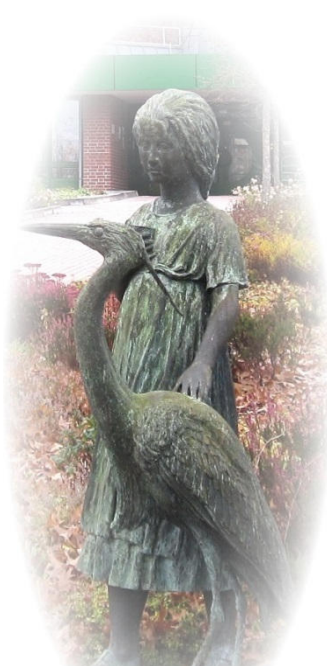
Skulptur „Kleine Dott“ von Bernd Streiter

Direkt in Höhe der Schranke steht das Denkmal der „ Kleinen Dott “, ein Wahrzeichen der Prignitz, welches von dem in Havelberg geborenen Künstler Bernd Streiter geschaffen wurde. Sie gehen dann zurück zur Straße und können jetzt über die Plattenburger Straße wieder zurück zum Markt gehen. Vor der Kirche biegen Sie ab und gehen quer durch den Goethepark (26) , dem ehemaligen Schlossgarten mit einem sehr schönen, teils exotischen Baumbestand. Nach Überquerung der Dr.-W.-Harnisch-Straße sehen Sie rechts auf der anderen Straßenseite ein Kriegerdenkmal (27) der Stadt, welches an die Gefallenen der napoleonischen Befreiungskriege von 1866 bis 1870 erinnert.